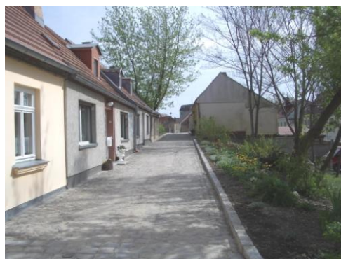
Nach der Baumaßnahme: Wallgasse