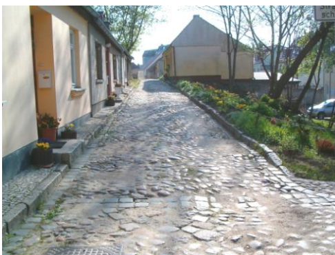
Vor der Baumaßnahme: Wallgasse